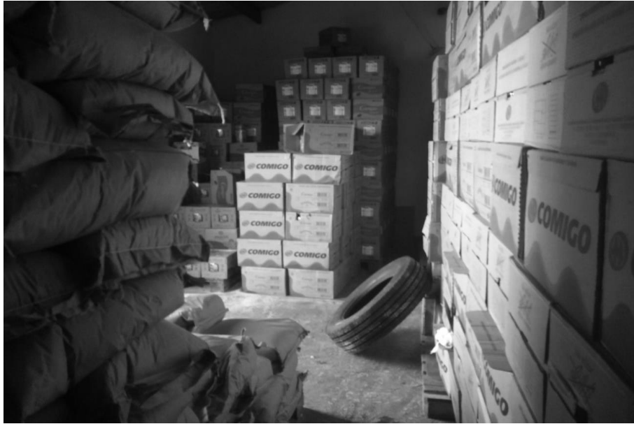
Figura 1 – Estoque antes da implantação do estudo.