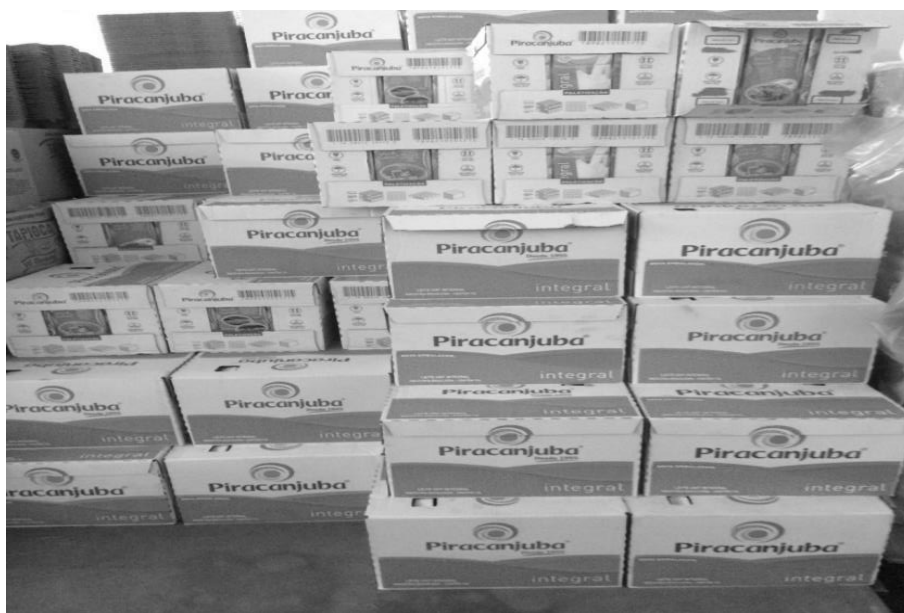
Figura 4: Ordem de separação por data

A organização feita pelos produtos e por data de validade gerou a melhoria na movimentação e nas retiradas. Os produtos foram organizados por datas de acordo com seu prazo de validade, os que ficavam na frente tinham um prazo menor e os de fundo um prazo maior, de acordo com a retirada ia sempre saindo em ordem, não haveria mais o trabalho da verificação diária que antes era feita, a figura 4 mostra a reorganização por datas de validade.