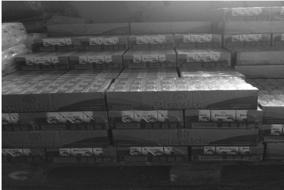
Figura 2 Limpeza e organização novos paletes.

A facilidade na retirada de produtos foi um grande destaque depois desta reorganização. Um grande diferencial notado principalmente pelos os funcionários que eram responsáveis pela retirada dos produtos colocados para o reabastecimento das prateleiras do supermercado e até mesmo no momento de colocar as mercadorias nos caminhões que faziam as entregas em outras cidades.